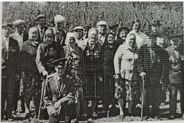
Участники Великой Отечественной Войны и вдовы погибших п. Комсомольский

Памяти наших прадедов, дедов, отцов, старших братьев, памяти солдат и офицеров Советской Армии, павших на фронтах Великой Отечественной войны, посвящается.